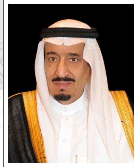
خادم الحرمين الشريفين

ولي العهد ونائب رئيس مجلس الوزراء - حفظه الله