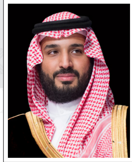
صاحب السمو الملكي